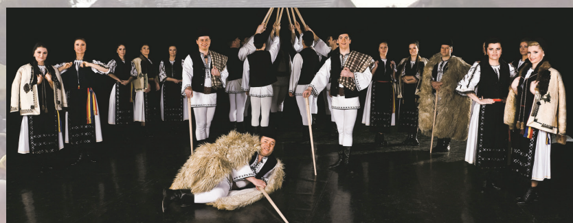
Ansamblul Folcloric Profesionist „Cindrelul-Junii Sibiului”